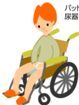
車椅子や椅子の上で