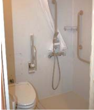
シャワーユニット